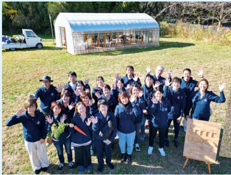
事務局メンバーでの合宿の一コマ。得意分野を持ち寄り、さまざまなプロジェクトを推進しています。

ライフイベントやキャリアステージに応じて、多様な働き方を行ったり来たりしながら、誰もが自律的にキャリアを築ける世の中にしていきたい。そんな想いから2017年1月、フリーランス協会は誕生しました。私たちがめざすのは、フリーランスによる、フリーランスのための、オープンでゆるやかなつながりを持ったネットワークです。一人ひとりとは独立した小さな存在でも、みんなで集まれば、さまざまなコラボレーションが生まれ、社会に対して声を届けやすくなります。誰もが自分らしい働き方を選択できる社会を実現するために、ぜひ一緒に、大きなムーブメントをつくっていきましょう!